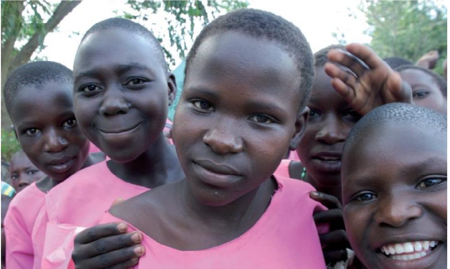
Kinder sollen gesund aufwachsen können