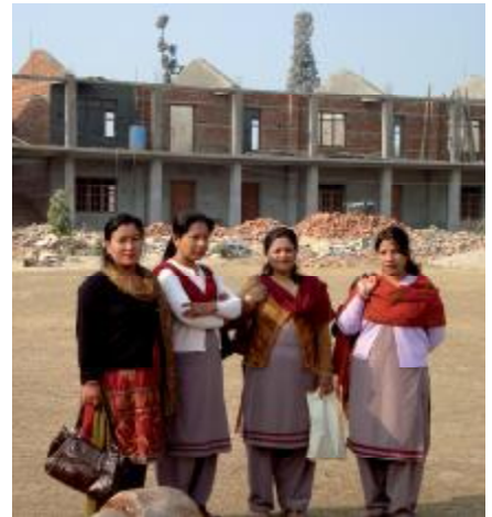
Das Schulbauprojekt der „Erika und Christoph Knoche Stiftung“