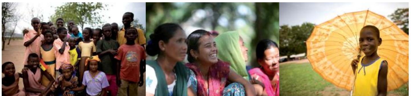
Langfristige Hilfe erreicht viele Generationen

Auch das Kinderhilfswerk hat in seiner über 70jährigen Geschichte verschiedene Arbeitskonzepte entwickelt. Seit 2003 trägt der Arbeitsansatz der kindorientierten Gemeindeentwicklung den Veränderungen in der Entwicklungszusammenarbeit Rechnung. Partizipation, Gleichberechtigung sowie Stärkung der Kinder und Jugendlichen sind die Bausteine, um die Lebenssituation von Menschen, die in Armut leben, zu verbessern. Neben wichtigen infrastrukturellen Projekten wie dem Bau von Schulen, Gesundheitszentren oder Trinkwasseranlagen, spielen „weiche Projekte“ eine ebenso ausschlaggebende Rolle: Dazu gehören z.B. Fortbildungen von Lehrpersonal, Aufklärungskampagnen oder die Stärkung von lokalen Partnern und anderen zivilgesellschaftlichen Gruppen in Netzwerken und Bündnissen. Lobbyarbeit hat das Ziel, national und internationale Gesetze und Abkommen zum Schutz der Kinder zu erreichen.