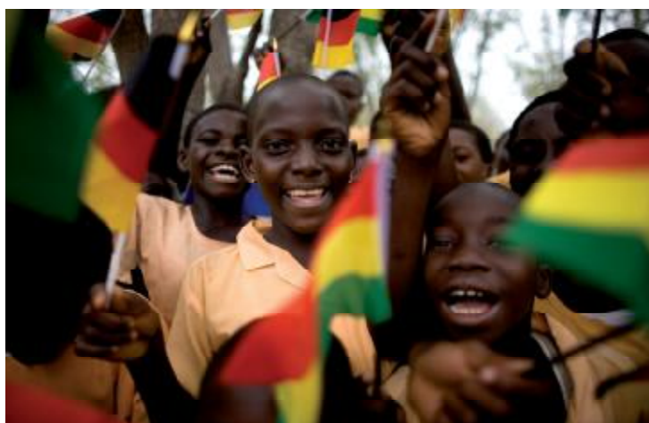
Ein herzlicher Empfang für die Gäste