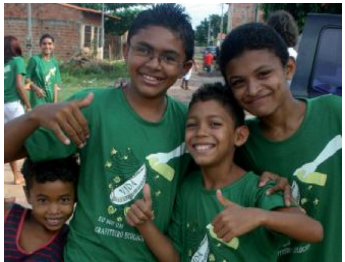
Der Enthusiasmus der Kinder ist ansteckend