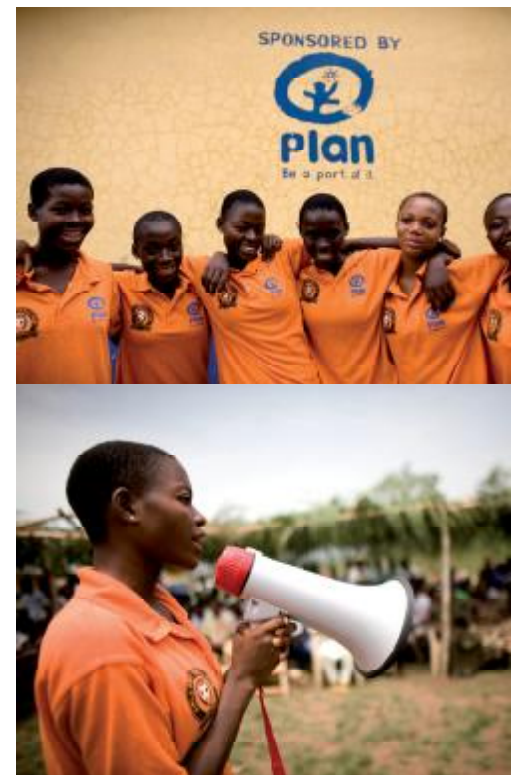
Kicken macht Mädchen stark