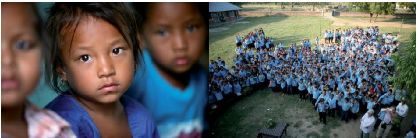
Gute Bildung hilft den Kindern am meisten