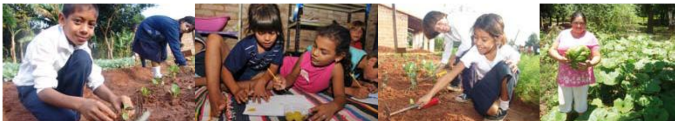
Von den Schul- und Familiengärten profitieren Kinder und Erwachsene gleichermaßen

Gern senden wir Ihnen bei Interesse weitere Informationen und Zwischenberichte zu.