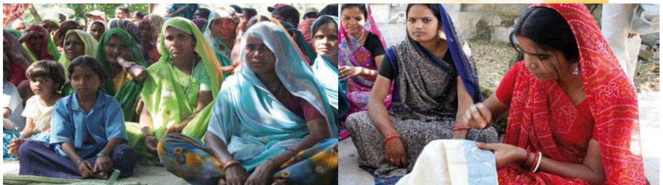
Treuhandstiftungen unterstützen u.a. das Indien-Projekt „Förderung von Kindern im Vorschulalter“