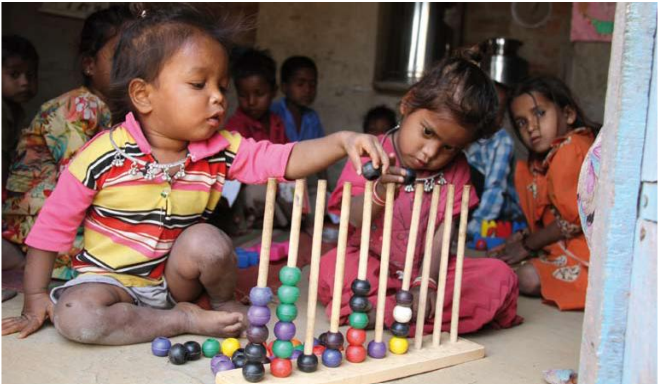
Kleinkindförderung erleichtert später den Schulbesuch