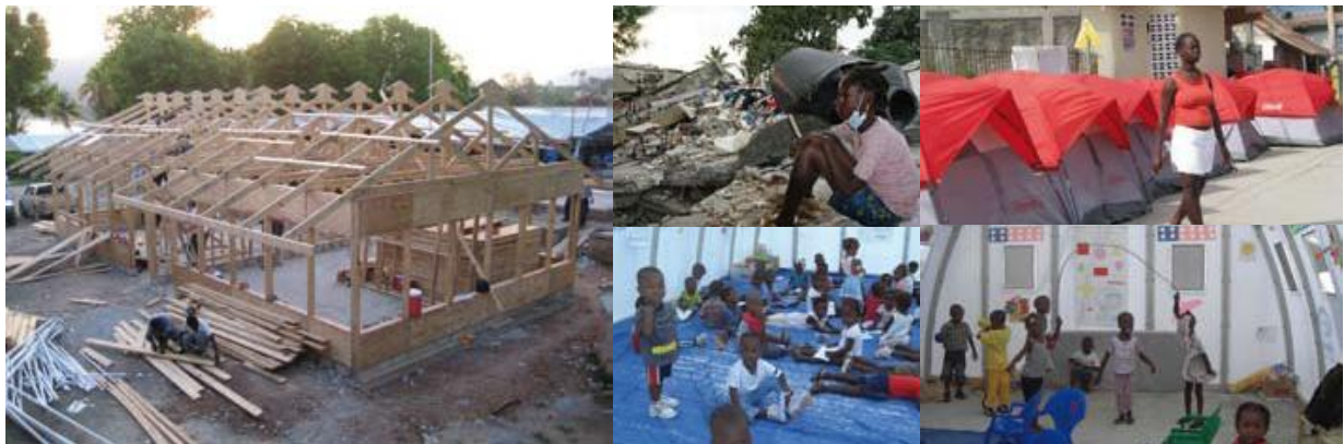
Plan baut Übergangsschulen in Haiti