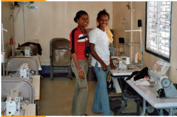
In der Werkstatt werden junge Frauen zu Näherinnen ausgebildet.