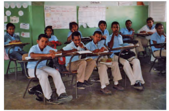
Die Schülerinnen und Schüler werden in zwei Schichten unterrichtet.