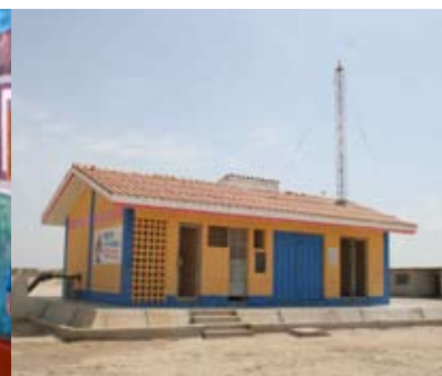
Lorem ipsum sine dolor amet