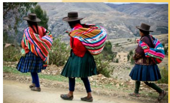
Die Armut in den ländlichen ...