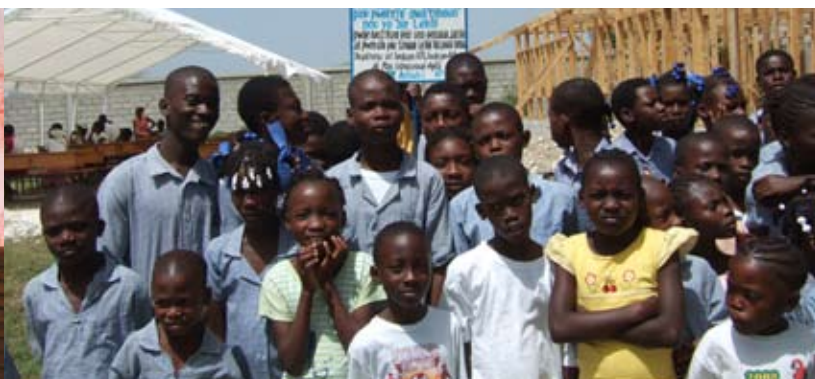
Die Kinder freuen sich über ihre neue Schule