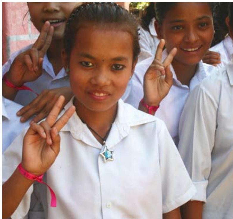
Ex-Kamalaris freuen sich auf den Schulbesuch

Die Haspa Hamburg Stiftung startete am 1. Februar 2005. Sie verwaltet unter ihrem Dach eigene Stiftungen, die inzwischen über 200 Organisationen unterstützen konnten, vor allem in Hamburg.