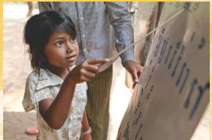
Instrumente der Qualitätssicherung sind Bestandteil der Programmarbeit