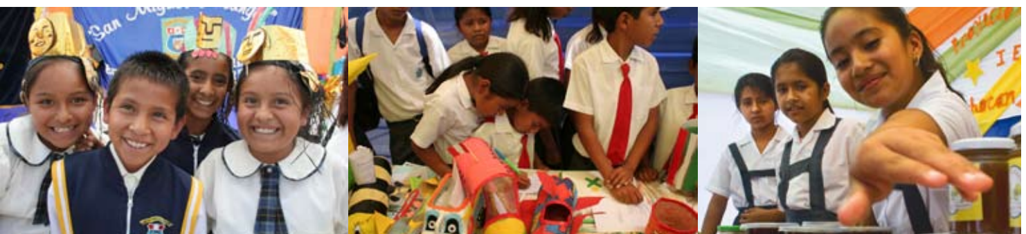
Begeistert zeigen die Kinder ihre Produkte und bieten sie zum Kauf an