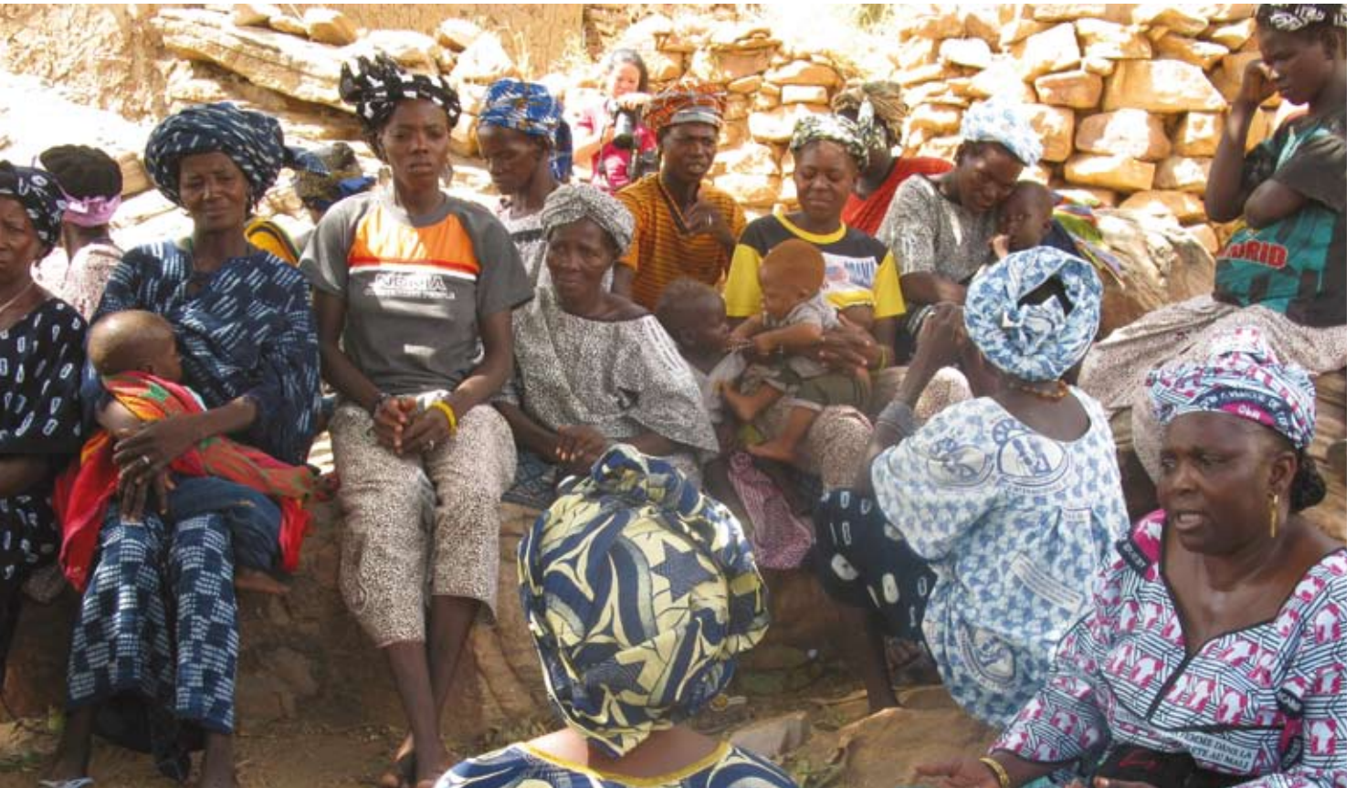
Dialog und Informationsveranstaltungen tragen zu Einstellungsveränderungen bei