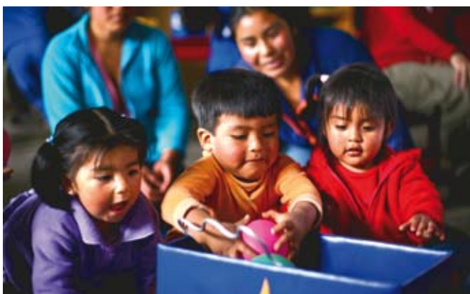
Frühkindliche Förderung legt den Grundstein für ein gesundes Aufwachsen

Plan arbeitet in Peru seit 1994 aktiv mit benachteiligten Kindern, Familien und Gemeinden. Mehr als 310.000 Menschen profitieren von den Projekten in den Bereichen Gesundheit, Bildung mit Schwerpunkt frühkindliche Förderung, Beteiligung und Einkommenssicherung