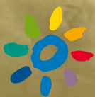
Ein herzlicher Empfang